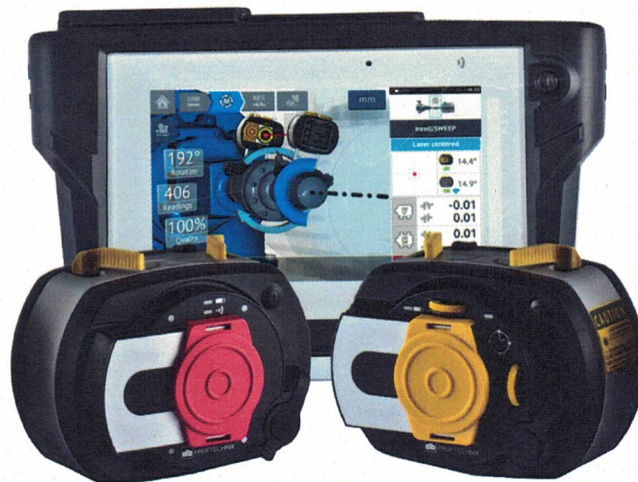
Рисунок 1 – Общий вид систем лазерной центровки PRÜFTECHNIK

Опломбирование корпуса систем от несанкционированного доступа не предусмотрено.